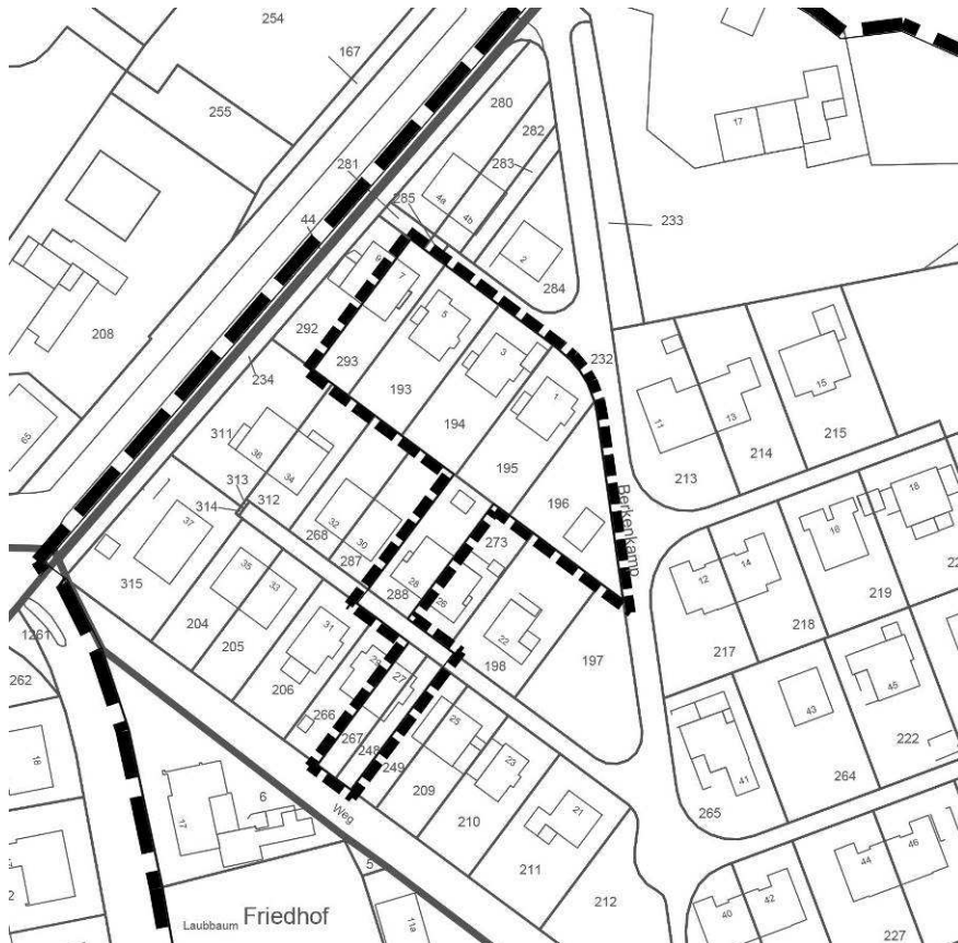
Abb. 1: Geltungsbereich des Bebauungsplans Nr. 35 – 6. Änderung „Berkenkamp“

Der ca. 2.830 m 2 große Änderungsbereich liegt etwa 1,5 km nordöstlich des Ortskerns von Ostbevern innerhalb der Wohnsiedlung Berkenkamp. Er beinhaltet die Grundstücke der Wohnhäuser Berkenkamp 1, 3, 5, 7, 27 und 28 sowie den nördlichen Gemeinschaftsstellplatz. Der räumliche Geltungsbereich beinhaltet die Flurstücke 193, 194, 195, 196, 232 (tlw.), 248, 267, 288 und 293 der Flur 21 in der Gemarkung Ostbevern.