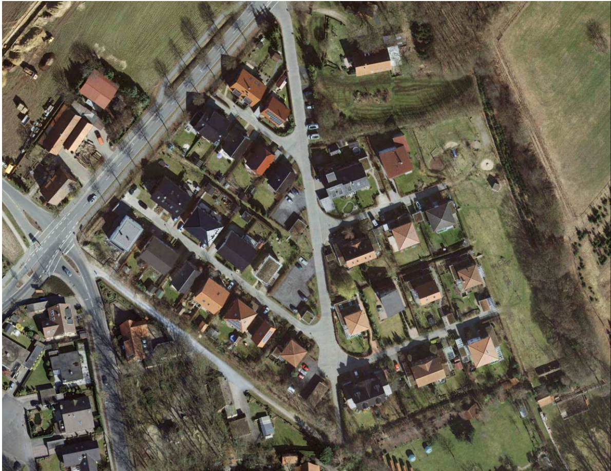
Abb. 2: Luftbild der Wohnsiedlung Berkenkamp

steht außer Frage, dass die Wohnbedingungen in der Wohnsiedlung ausgesprochen gut sind und die Bebauung in ihrer jetzigen Form städtebaulich erhaltenswert ist.