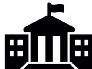
Rathaus / öffentliche Gebäude