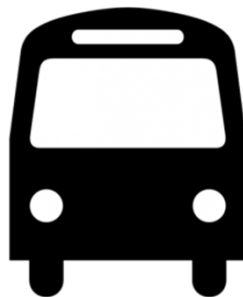
ÖPNV / Transportwesen