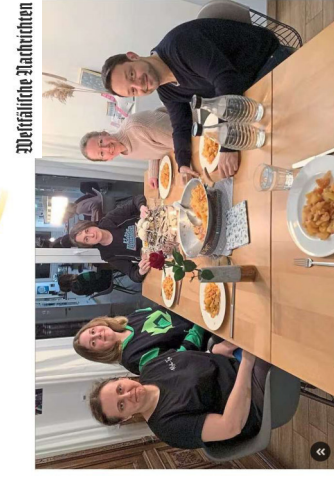
Wolke, Krieger und Kriegerin (L) und ihre mit Begleitern bei Ostbevern. Ein Bild, das die menschlichen Abstraktionen einer Barackenstadt (Krieger, Tante und Eugene) kommen aus der Geburtsstadt von Präsident Wolodymyr Selenskyj und dort freies Leben möglich zu sein.