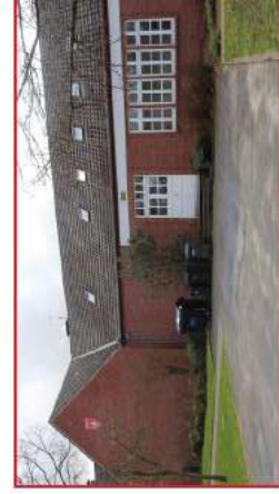
Schmiedehausener Straße 6