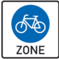
Abbildung 2 Verkehrszeichen Fahrradzone

Eine Fahrradzone ist eine Verkehrsfläche, die in der Regel ausschließlich von Fahrradfahrern genutzt werden darf. Die Zonen werden mit folgenden Verkehrszeichen ausgewiesen: