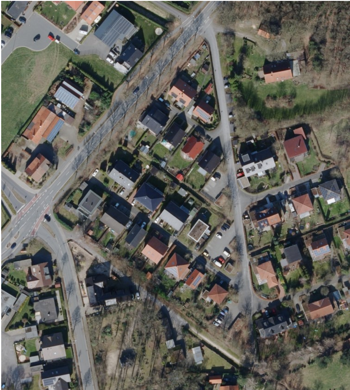
Abb. 2: Luftbild der Wohnsiedlung Berkenkamp

Die im Ursprungsbebauungsplan Nr. 35 „Berkenkamp“ und seinen Änderungen 1 bis 6 festgesetzten Bauflächen für ein Allgemeines Wohngebiet (WA) sind vollständig bebaut. Entstanden ist eine städtebaulich und architektonisch ansprechende Wohnsiedlung, in der auch ökologische Aspekte wie z.B. die Begrünung von Fassaden und Dächern, eine Versorgung mit Nahwärme und die oberirdische Ableitung und Versickerung von Regenwasser vorbildliche Umsetzung fanden.