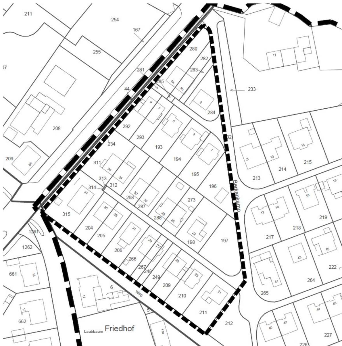
Abb. 1: Geltungsbereich des Bebauungsplans Nr. 35 – 7. Änderung „Berkenkamp“

Der ca. 11.460 m 2 große Änderungsbereich liegt etwa 1,5 km nordöstlich des Ortskerns von Ostbevern innerhalb der Wohnsiedlung Berkenkamp. Der räumliche Geltungsbereich beinhaltet die Flurstücke 193, 194, 195, 196, 197, 198, 204, 205, 206, 209, 210, 211, 248, 249, 266, 267, 268, 273, 280, 281, 282, 283, 284, 285, 287, 288, 292, 293, 311, 312, 313, 314 und 315 der Flur 21 in der Gemarkung Ostbevern.