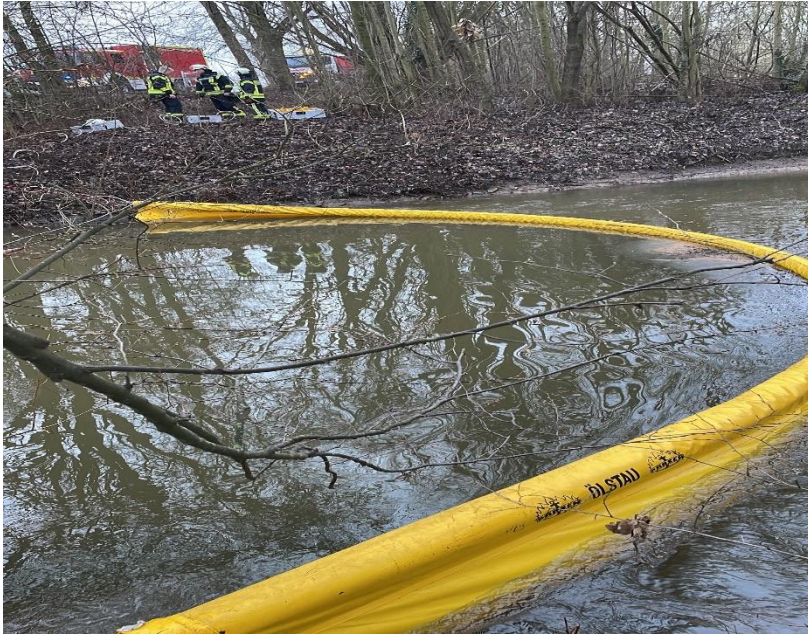
Januar Öl auf der Bever